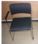
肩肘チェア（4脚まで） W500×D500×H750

※白パネルは、画鋏などを使った軽量の装飾は可 ※社名版あり ※電源なし ※本仕様は、変更となる場合があります